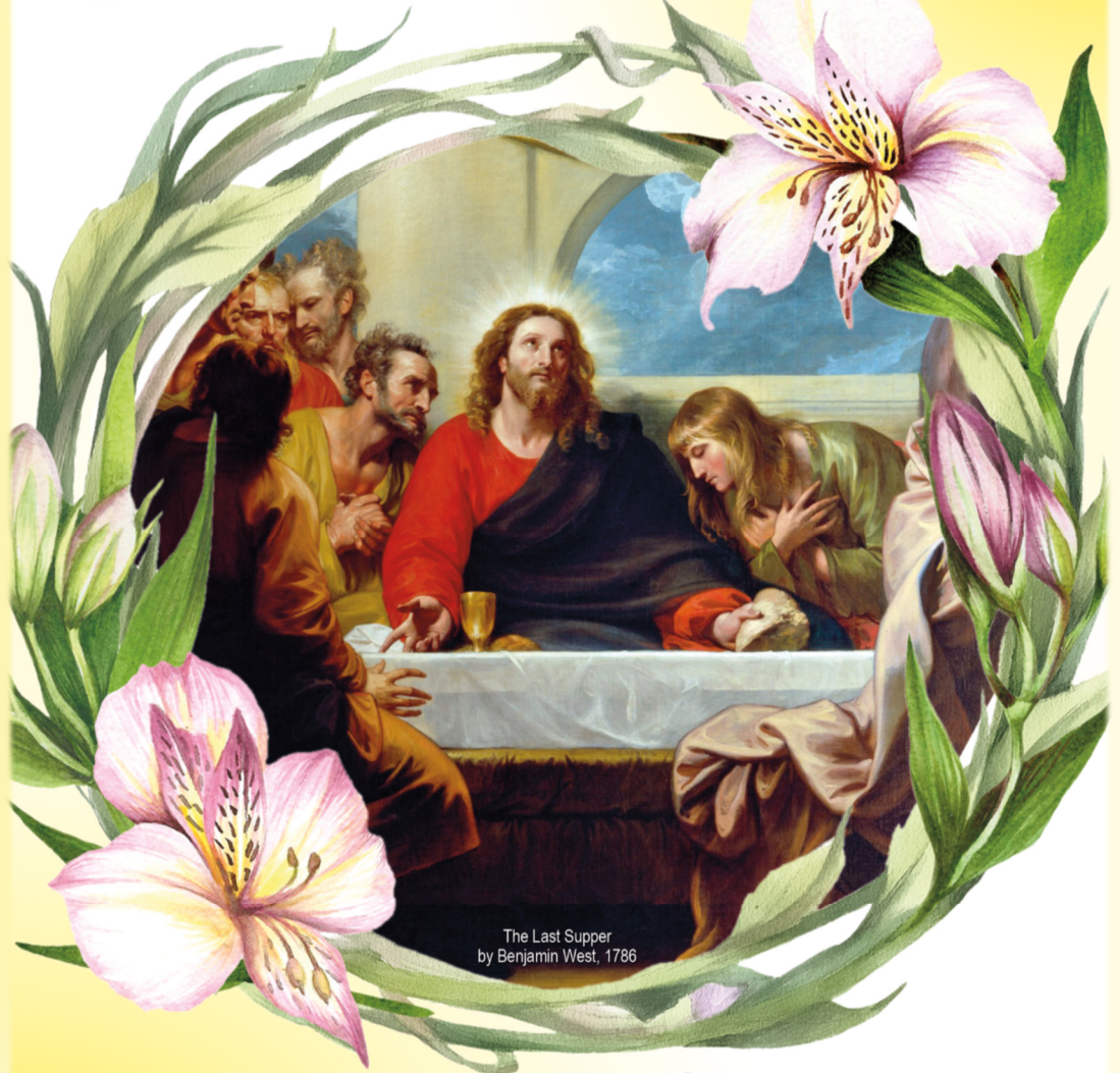
The Last Supper by Benjamin West, 1786

“Si alguien me ama, guardará mis palabras, y mi Padre lo amará. Entonces vendremos a él para poner nuestra morada en él.” Juan 14, 23